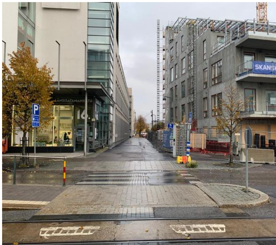
Länsisatamankadun tien ylityksen turvallisuuden parantaminen