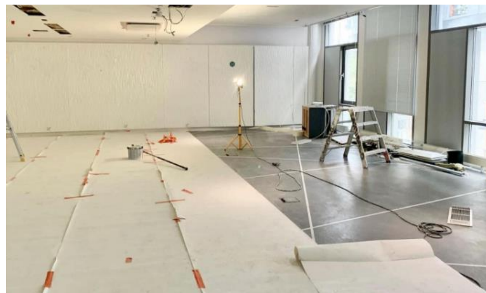
Tilojen remontointi koulun käyttöä varten on alkanut.